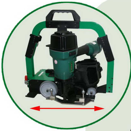
Anwendbar in beide Richtungen